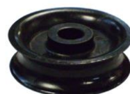
Codes A, B, C Réa polyamide