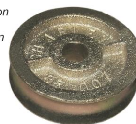
Code D Réa fonte alésée